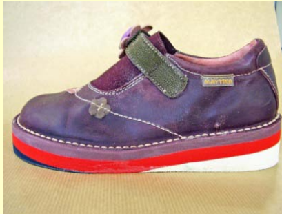
compensation de la cambrure