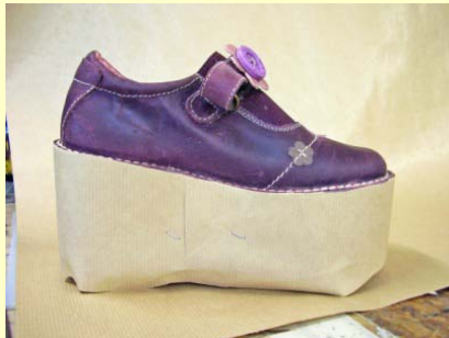
préparation du gabarit de l'enrobage