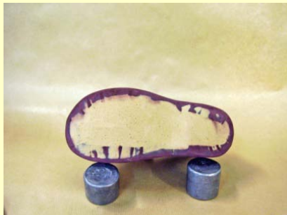
préparation au semelage