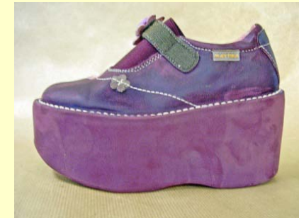
collage de l'enrobage