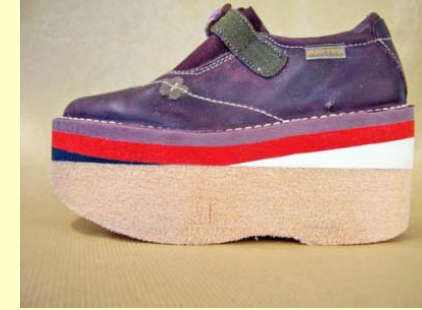
finition du déroulement et ajustage de la hauteur