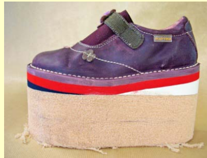
collage du matériel de compensation (très léger)